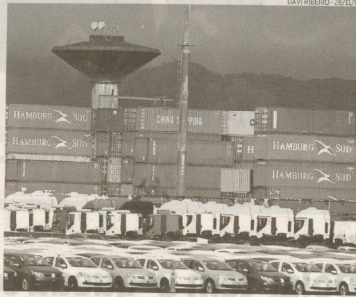
Terminal de Veículos fica ao lado do Tecon, da Santos Brasil

Conforme publicado ontem em A Tribuna , o Grupo Libra teve a chance de apresentar recursos à proposta feita pela empresa da Santos Brasil S.A, na